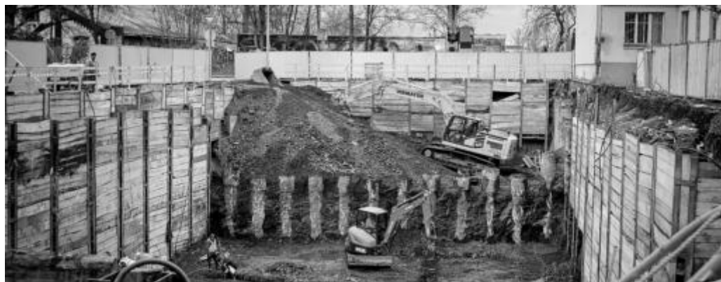
stavba nové budovy školy (aktuální stav)