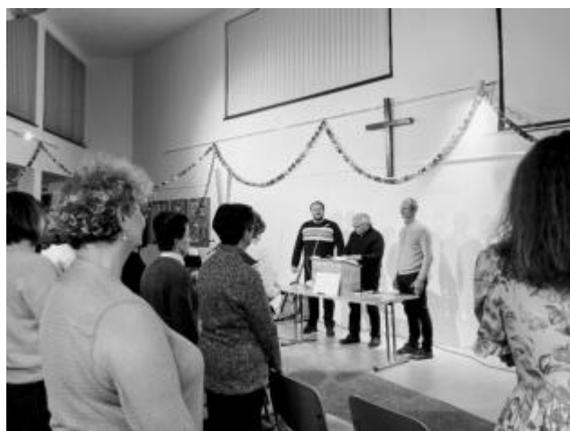
setkání v Přešticích