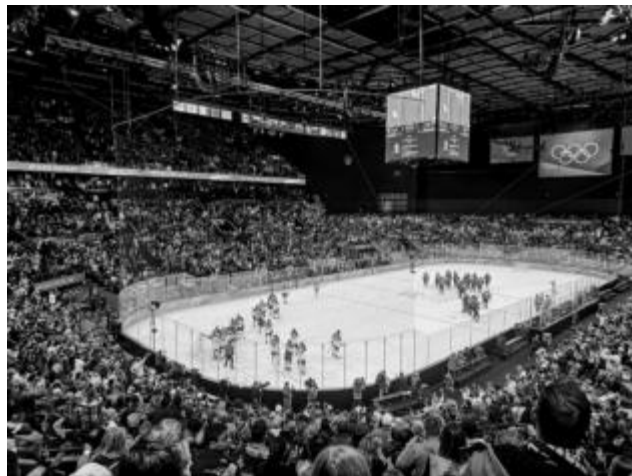
hokejový zápas Česka proti Kanadě (ZOH 2026)

To by byla asi spíše otázka na ně... Myslím si, že má služba olympijského kaplana příliš neomezuje mé působení jako faráře ve farnosti. Jsem tak moc vděčný svým kolegům z řad kněží a jáhnů, kteří jsou ochotni mne během olympiády zastoupit a pomoci.