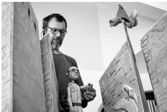
s Drak'n'Roses v Poděbradech (2023)

Kromě toho dříve pracoval na částečný úvazek přímo v soběslavském středisku Diakonie, kde vedl dřevodílnu pro uživatele služeb. Mimo evangelické prostředí se podílel na obnově želivského kláštera či trapistického řeholního domu v Novém Dvoře. Pro trapisty vyráběl kopii románské dřevěné plastiky madony. Vzpomíná, že práce ho bavila, ale vnitřně váhal, jestli se nedopouští idolatrie. „Sám sebe jsem uklidňoval, že ne. Ale pak jsem otevřel Bibli a tam zrovna bylo, jak si tesař vytesá modlu, odřezky zatopí a říká si, jak se hezky zahrál (Iz 44,13–16). „Den předtím jsem si pochvaloval, jak dobře ty odřezky hoří. A pak tohle.“