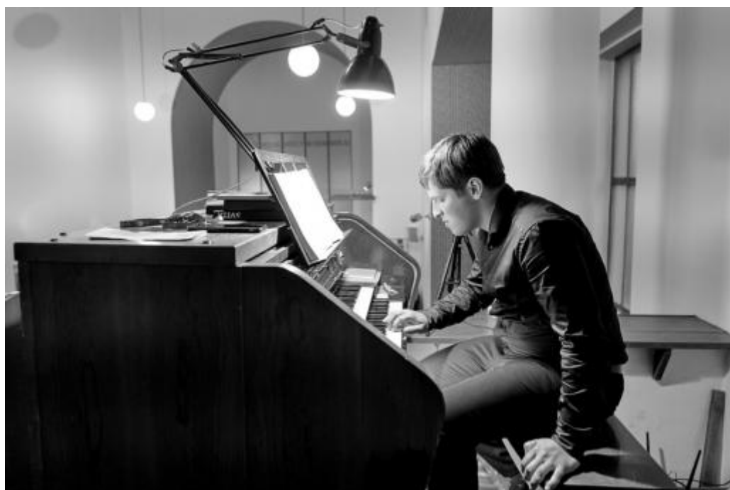
při hře na varhany

zazní nějaká zajímavost, která je tak dobrá, že se o ni potřebuju podělit. A taky mám pocit, že lidé úplně netuší, co studium teologie je, takže chci trochu přiblížit, co to vlastně jsou ti faráři a křesťané a teologové. Inspirace vychází ze zajímavostí, co nám říkají profesori, a také musí nutně přicházet i odněkud „shora“, od Pána Boha. Když dělám příspěvky k Heslům Jednoty bratrské, často vůbec nevím, co k tomu říct, a mám pocit, že bych jenom blábolil. Modlím se, prosím Pána Boha o to, aby tam zaznělo něco plodného. A ono něco přijde, vyvine se to a rozkvete v něco, s čím jsem spokojený.