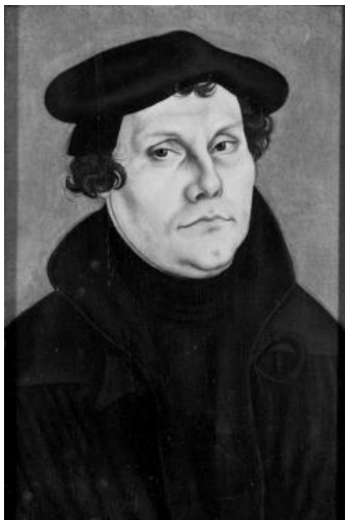
Martin Luther (Lucas Cranach st., 1528)

uložit a je možné to změnit? Všechny tyto otázky si musel Luther položit, než dospěl k závěru, kterým ovlivnil pojetí povolání na další staletí.