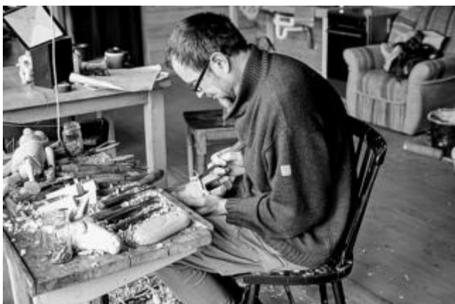
při práci na jedné z loutek

dočasná záležitost, protože se tomu tehdy věnovalo hodně lidí.“