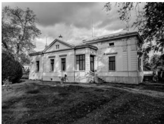
venkovní pohled – současný stav fary

kurzy a přednášky. Je toho mnoho, co se v areálu nymburského evangelického sboru dělo a děje. Bratři a sestry by rádi vymysleli ještě další akce. Já ale svou kapacitou a dispozicemi bohužel všem těmto požadavkům nestačím.